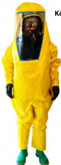
Abb. 3 oben Körperschutz, FFP3 und Augenschutz