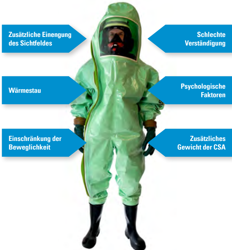
Abb. 5 Belastungen für Körperschutzträger