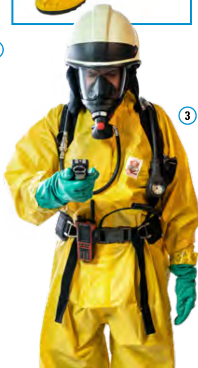
Abb. 6 Anlegen Körperschutz Form 2