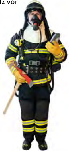
Abb. 1 oben Körperschutz Form 1

Schützt ausschließlich gegen eine Kontamination mit festen Stoffen und stellt einen eingeschränkten Spritzschutz dar. Sie ist weder flüssigkeits- noch gasdicht