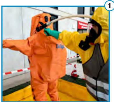
Grobreinigung mit B-Strahlrohr