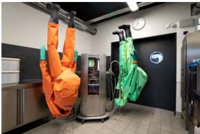
Abb. 10 Atemschutz- werkstatt