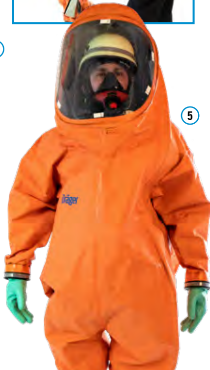
Abb. 8 Anlegen Körperschutz Form 3