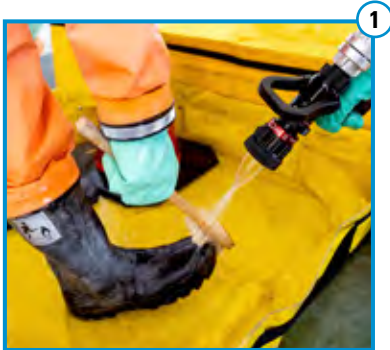
Vorreinigung Stiefel und Handschuhe